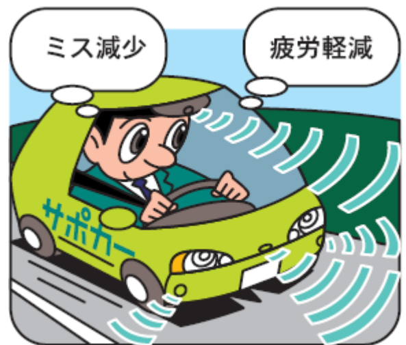
【車線逸脱警報装置の作動例】