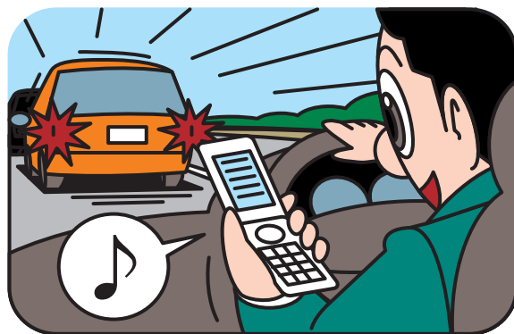
【携帯電話使用等(保持)の点数と反則金】

同乗者との会話は眠気を防止するという良い面もありますが、会話に夢中になると周囲に対する注意が欠けて危険の発見が遅れてしまうことがあります。運転中は同乗者との過度な会話は控え、しっかり周囲を見て運転しましょう。